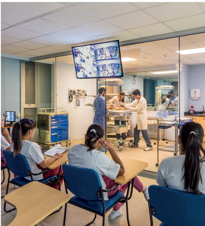
Centro de simulación clínica