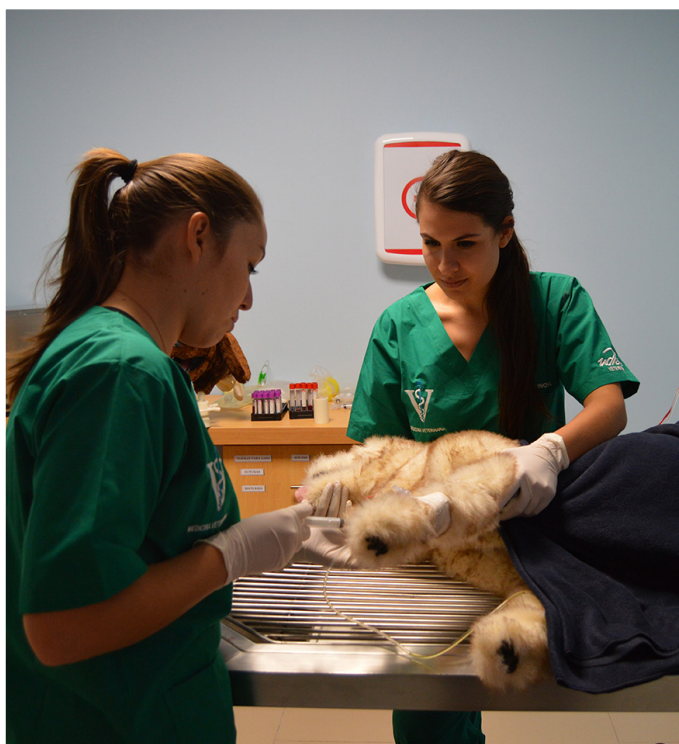
Centro de simulación veterinaria