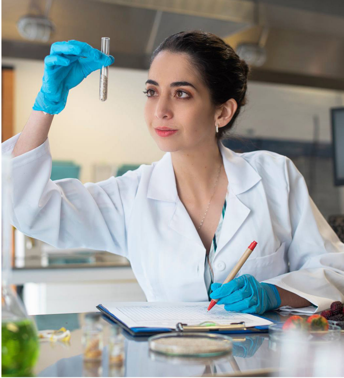
Laboratorios de agro industria