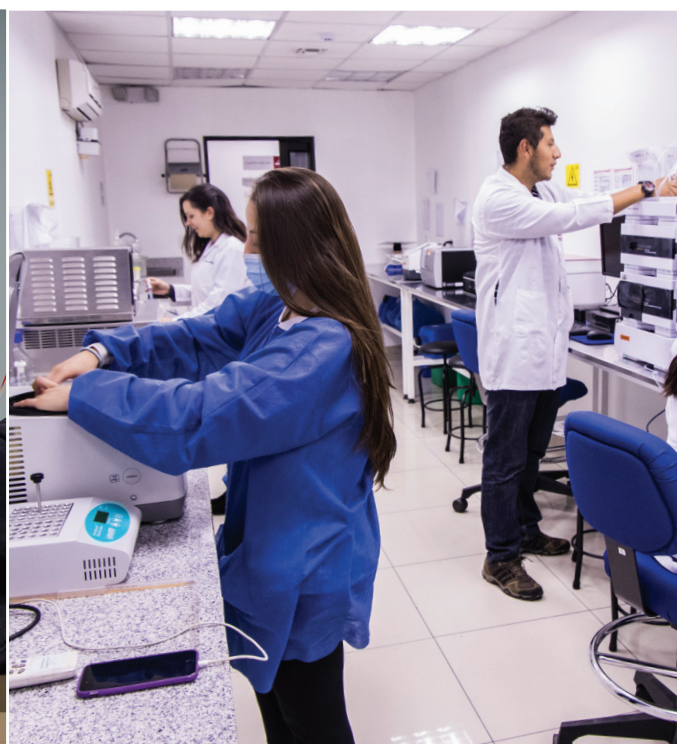
Laboratorios de Ciencias Biológicas y Químicas (LACBYQ)