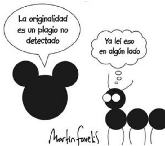
Figura 1. Caricatura sobre plagio. Este apartado sirve para explicar la figura y darle un título, debe colocarse dentro del diseño. Adaptada de Favelis, s.f.

*NOTA IMPORTANTE: Ninguna figura, ni tabla debe ir enmarcada.