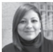
SANDRA DE LA CADENA S. Coordinación y edición MundoUDLA