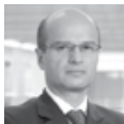
CARLOS LARREÁTEGUI Rector Universidad de Las Américas