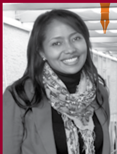
Docente de la Escuela de Hospitalidad y Turismo

Durante el período prehispánico, el culto a los muertos representaba una parte importante de la cosmovisión. Los indígenas consideraban que los ancestros proporcionaban protección desde el otro mundo.