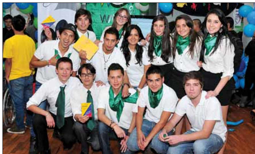
Los integrantes de la empresa ganadora del primer lugar, Wawa Viajero, manifestaron su alegría por el reconocimiento a su trabajo y creatividad.

través de sus leyendas más populares; Pahuana, paseos en avioneta; Ecumar, que ofrece varias actividades acuáticas; GHT Grant Havy Travel, especializado en turismo para personas con discapacidad; Tawa chacana, que expone turísticamente el quehacer industrial en cuanto al sembrío, pesca y producción