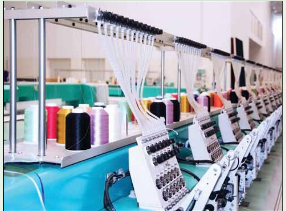
▲ Textil / Esta industria está compuesta por más de 30 000 compañías dedicadas a la confección de prendas, lo que genera entre 14 a 15 millones puestos de trabajo.