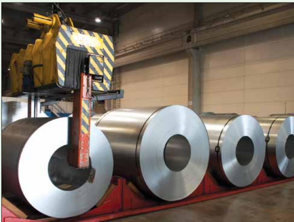
▲ Metalurgia / Este sector representa alrededor del 22,3% del consumo energético industrial proveniente de combustibles fósiles y de la biomasa.