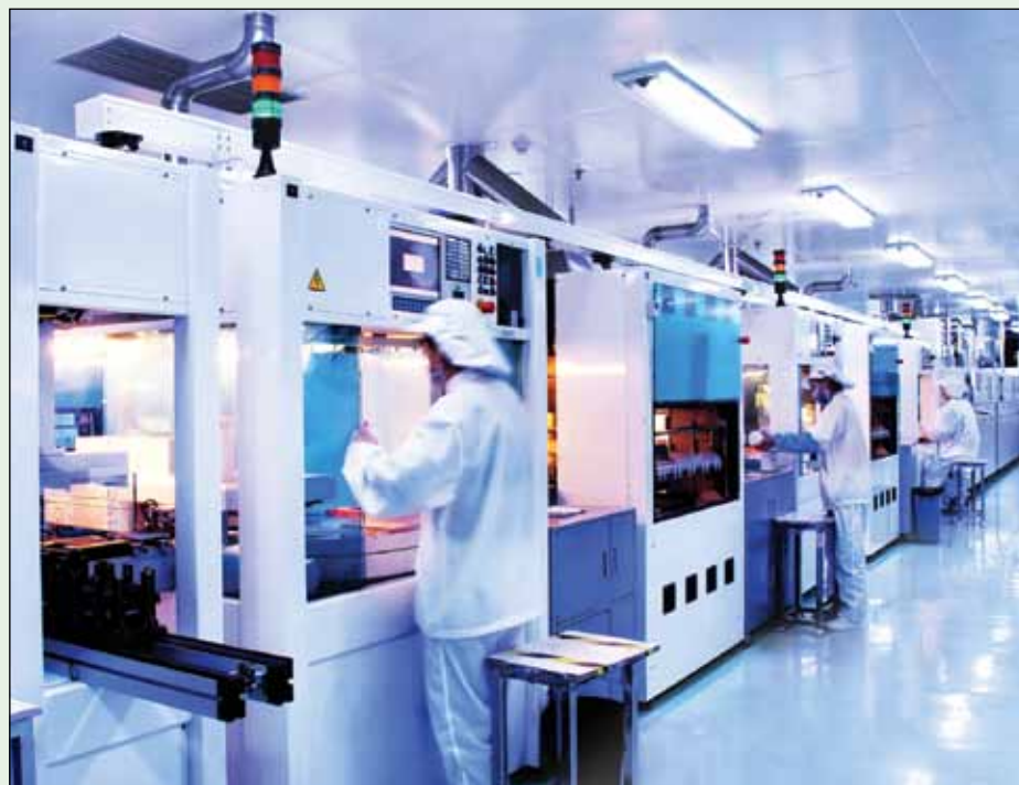
▲ Farmacéutica / Brasil es el noveno mayor mercado de fármacos y medicamentos en el mundo y refuerza su inversión en investigación.

/// Representantes de empresas brasileñas y ecuatorianas se citaron en la Universidad para explicar a los estudiantes aspectos del comercio entre ambos países y las oportunidades de emprender nuevos negocios.