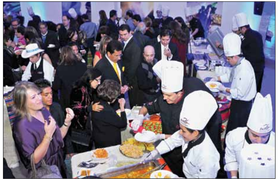
Más de 25 recetas mencionadas en el ejemplar se degustaron en el evento.