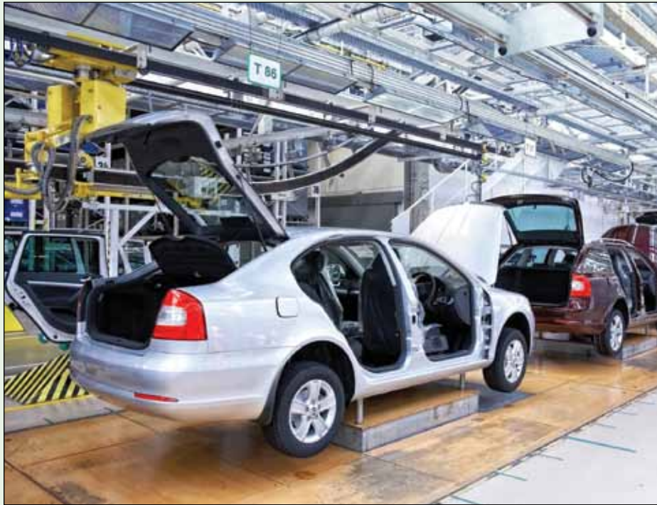
▲ Automotriz / En 2011, Brasil fue por primera vez el cuarto mayor mercado automotor después de China, Estados Unidos y Japón.