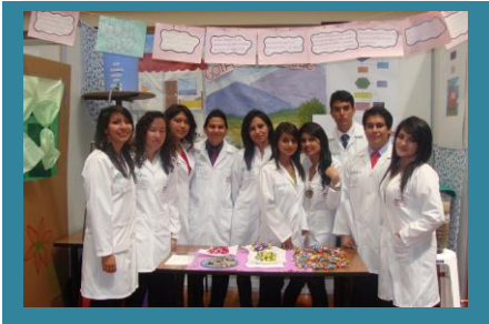
Participan 196 estudiantes de la carrera más 3 docentes

Este proyecto beneficia a 196 estudiantes Participaron todos los estudiantes de la carrera.